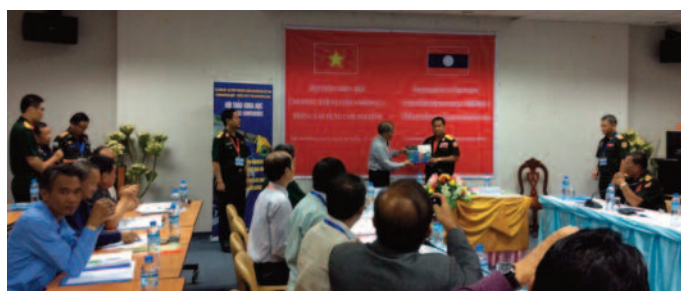
Ban chủ nhiệm Chương trình KHCN vũ trụ đã trao tặng cuốn "Việt Nam dưới góc nhìn VNREDSat-1" cho Cục Bản đồ QĐND Lào