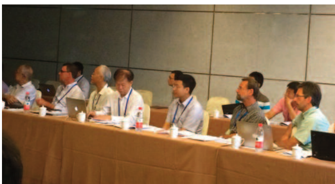
Hội thảo quốc tế lần thứ hai về khoan thăm lục địa Sunda Tây Nam Biển Đông tại Thượng Hải, Trung Quốc

Từ ngày 11/7/2016 đến 13/7/2016, tại Thượng Hải (Trung Quốc), hội thảo quốc tế lần thứ hai về khoan thăm lục địa Sunda phía Tây Nam của Biển Đông đã được tổ chức, với sự tham gia của các quốc gia liên quan, trong đó có Việt Nam.