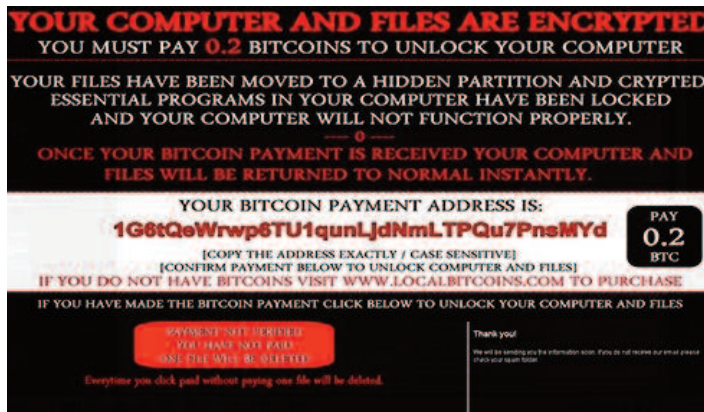
Một cảnh báo được đưa ra bởi ransomware Ranscam trên màn hình máy tính nạn nhân.

Theo SlashGear, có một sự gia tăng đáng lo ngại của các phần mềm độc hại trong giai đoạn hiện nay, đặc biệt là ransomware, bởi không chỉ nền tảng Windows mà cả Mac OS cũng bị tấn công.