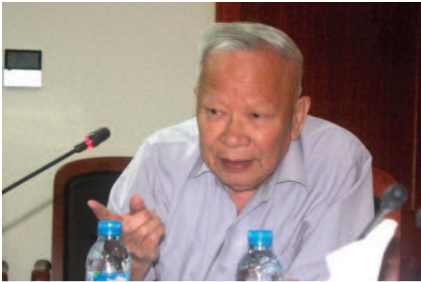
Nguyễn Phó thủ tướng Nguyễn Công Tạn

N guyên Phó thủ tướng Nguyễn Công Tạn là một nhà lãnh đạo và cũng là một nhà khoa học tâm huyết với nền nông nghiệp Việt Nam. Rất nhiều nghiên cứu thực tế nông học đã giúp ông có những quyết sách đúng đắn, mang lại lợi ích cho nông dân.