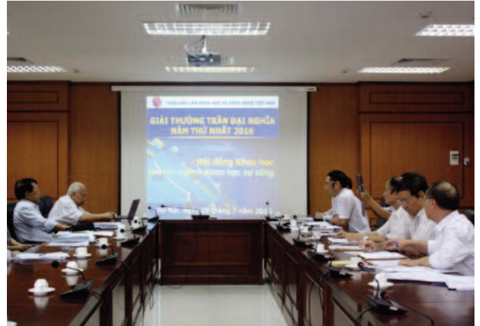
Hội đồng chuyên ngành Khoa học sự sống họp phiên thứ hai vào ngày 29/7/2016

Ngày 29/7/2016, Hội đồng chuyên ngành Khoa học sự sống đã họp phiên thứ hai. Hội đồng đã xây dựng bộ chấm điểm dựa trên 3 tiêu chí: số lượng công bố trong nước/quốc tế; số lượng bằng độc quyền sáng chế/giải