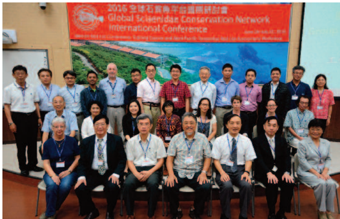
Các đại biểu tham gia hội thảo đánh giá các loài thuộc họ cá Đù

T ừ ngày 26/6 đến 1/7/2016, hội thảo đánh giá các loài thuộc họ cá Đù ( Sciaenidae ) có nguy cơ bị đe dọa vùng biển Tây Thái Bình dương theo tiêu chí của Liên minh Bảo tồn Thiên nhiên Quốc tế IUCN đã được tổ chức tại Trường Đại học Tổng hợp Quốc gia Sun Yat sen, Đài Loan.